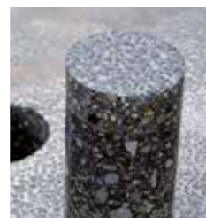
Creteo®Phalt su asfalto