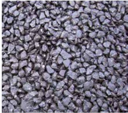
Struttura di supporto a base di asfalto

Le pavimentazioni semirigide del tipo Creteo®Phalt sono costituite da un supporto legato con bitume in cui gli spazi vuoti vengono poi riempiti con una malta fluida Creteo®Phalt. In tale modo si ottiene uno strato compatto, che combina in modo straordinario le caratteristiche della malta ad alta resistenza con la flessibilità del sistema bituminoso. Il tutto è realizzato con la posa di un supporto a base di asfalto con un contenuto di vuoti dell'ordine del 25-30 % che in una fase successiva vengono riempiti spargendovi sopra una delle malte ad elevata resistenza Creteo®Phalt.