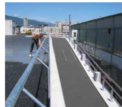
Aree di parcheggio incl. rampe