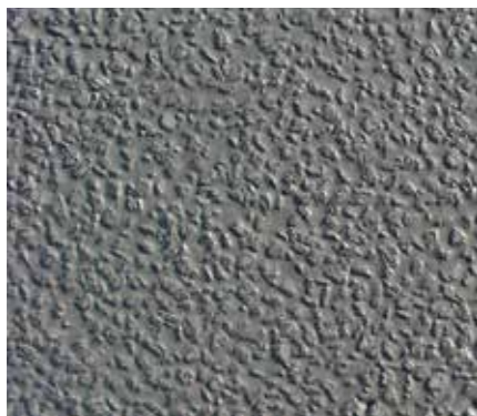
Creteo®Phalt - Rivestimento finito

Le malte Creteo®Phalt sono state appositamente sviluppate per il riempimento completo degli spazi vuoti della struttura di supporto a base di asfalto. Il tempo di presa stremamente breve in combinazione con il rapidissimo sviluppo della resistenza meccanica della malta Creteo®Phalt permette di utilizzare e caricare la superficie già dopo 12-18 ore. Inoltre le malte Creteo®Phalt sono compensate contro il ritiro in modo da ridurre la formazione di microfessure in superficie nonché di fessure più dannose nella costruzione. Crepe condizionati di sistema sono possibili e regolamentato in RVS 08.16.03/2014.