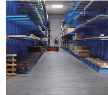
Capannoni di deposito