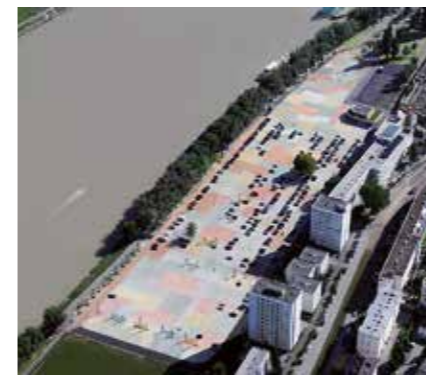
Aree di deposito industriali