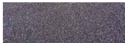
Spandimento di ghiaino

A seconda dell'intensità della levigatura si possono eliminare piccole irregolarità, ottenendo superfici molto piane, simili a un terrazzo alla veneziana.