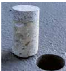
Creteo®Phalt su supporto conglomerato con legante idraulico

Le pavimentazioni semirigide del tipo Creteo®Phalt vengono realizzate normalmente con spessori variabili da 4 a 6 cm su uno strato portante di asfalto di usura. In condizioni particolari la posa va effettuata su un supporto consistente in un conglomerato con legante idraulico (HGT) o una platea in calcestruzzo.